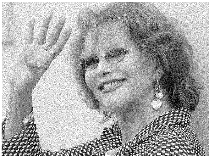
L'attrice Claudia Cardinale «Testimone del Tempo» al 40° Acqui Storia

Mario Calabresi, figlio del commissario Calabresi, ha voluto sottrarre all'oblio una delle pagine più drammatiche della storia italiana ovvero l'omicidio di suo padre. «L'Acqui Storia» giunge alla sua quarantesima edizione con un carnet straordinario di partecipanti, giurati e vin-